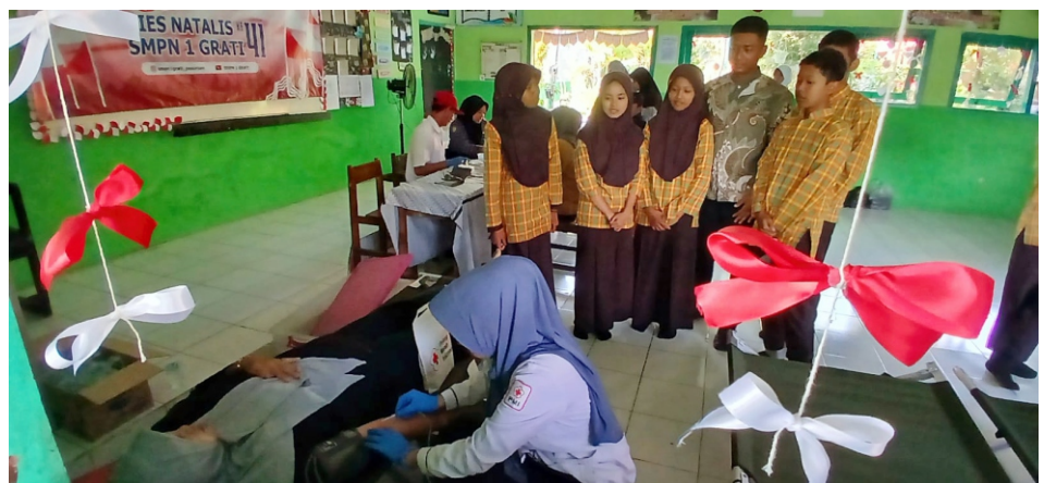
Tingkat antusiasme alumni untuk menjadi pahlawan kemanusiaan dengan menjadi pendonor darah terpantau sangat tinggi.