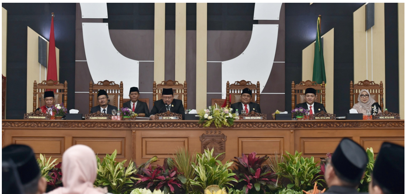
Pengesahan ini dilakukan pada Rapat Paripurna Keempat Pengesahan Raperda Non APBD (Perda KTR) di Gedung DPRD Kabupaten Pasuruan.

"Dengan ini nanti kami akan memerintahkan kepada Satpol PP untuk melakukan tindakan tegas bagi masyarakat yang melanggar. Meski hanya sanksi administratif, tapi ini bisa memberikan efek jera kepada pelanggar yang masih merokok di tempat yang ditentukan," jelasnya. (emil)