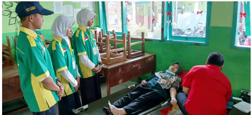
SMPN 1 Grati ajak guru sampai alumni donor darah.

"Kita persiapkannya hampir satu bulan. Mulai acara sampai hadiahnya. Siapa saja yang kita undang, dan printilan yang lainnya juga kami pikirkan dengan sangat baik. Dan alhamdulillah semuanya berjalan lancar," jelasnya. (emil)