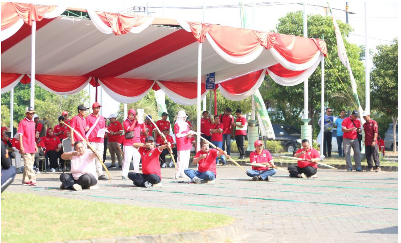
Dalam POR OPD kali ini, panitia hanya menggelar 3 cabor saja, yakni senam, tenis meja dan jemparingan alias panahan.