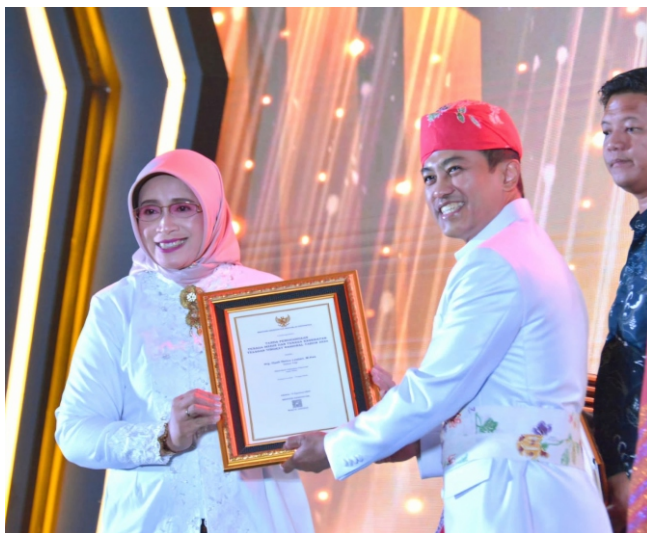
Penghargaan tersebut diserahkan oleh Wakil Menteri Kesehatan (Wamenkes) Dante Saksono Harbuwono.