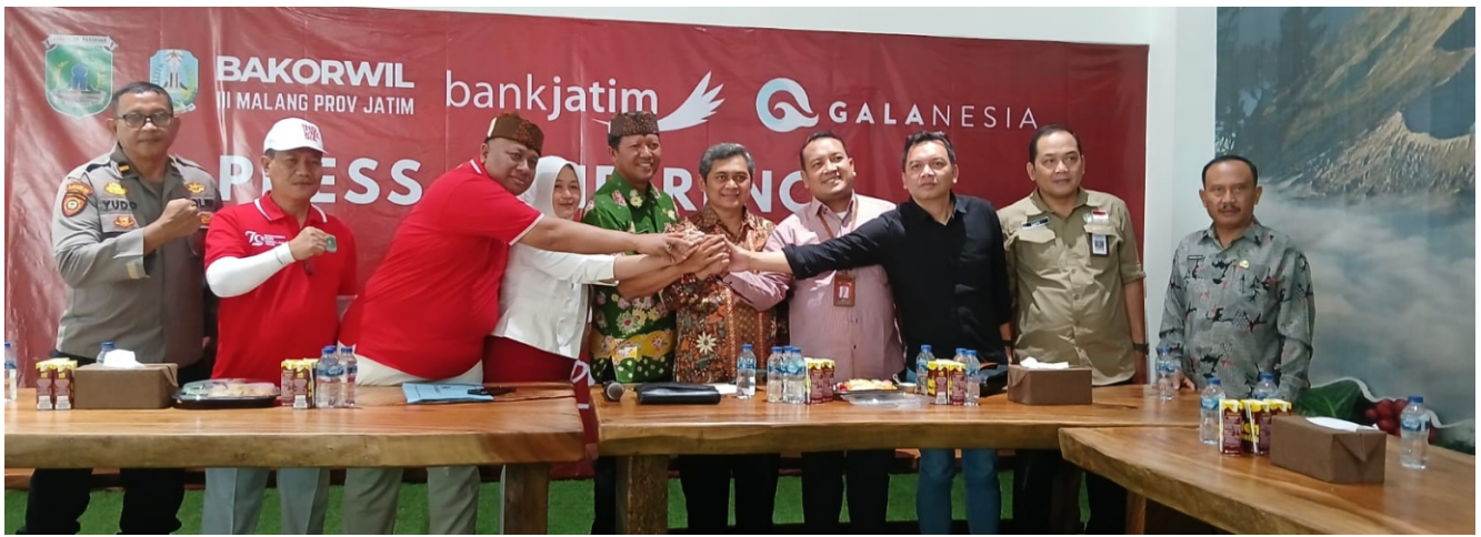
Tagline yang diusung dalam Pasuruan Bromo Marathon 2024 sama dengan Tahun 2023 kemarin, yakni Run The Adventure.