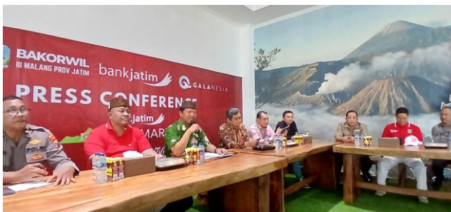
Tercatat ada peningkatan jumlah pendaftar Bromo Marathon 2024, yakni dari 1400 peserta menjadi 1600 runner dari 22 negara.

"Harus kita angkat bersama, dan ketahuilah bahwa pemerintah harus hadir dan mensupportnya . Mari kita berkolaborasi yang baik, bagaimana mengharmonikan kegiatan ini. Bukan hanya olahraganya saja, tapi wisata dan keindahan alam juga kita angkat dan jadikan tulisan di depan menjadi besar," tutupnya. (emil)