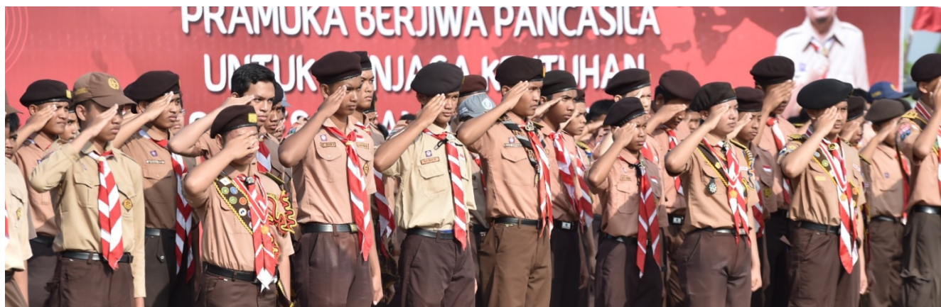
Adik-adik pramuka dari SDN Sumberejo Kecamatan Purwosari.

"Agar Pramuka menjadi gerakan yang mampu mengikuti arus zaman, semakin modern, profesional, dan sigap," ajaknya. (emil)