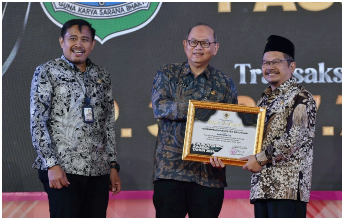
Gubernur Jawa Timur memberikan Penghargaan kepada Pemerintah Kabupaten Pasuruan sebagai Peringkat III Pemanfaatan Jatim Bejo.

"Kepada Kabag Pengadaan Barang/Jasa sudah kami perintahkan untuk mensosialisasikan betapa pentingnya belanja online kepada semua OPD. Termasuk sampai ke tingkat kelurahan," harapnya. (email)