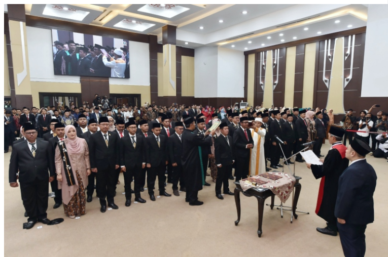
50 Anggota DPRD Kabupaten Pasuruan Terpilih Periode 2024-2029 resmi dilantik.

palu sidang dari Ketua DPRD lama ke Ketua DPRD sementara.