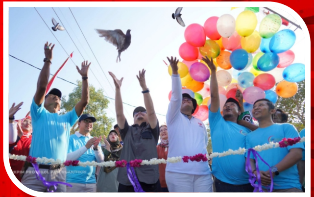
CAR FREE DAY