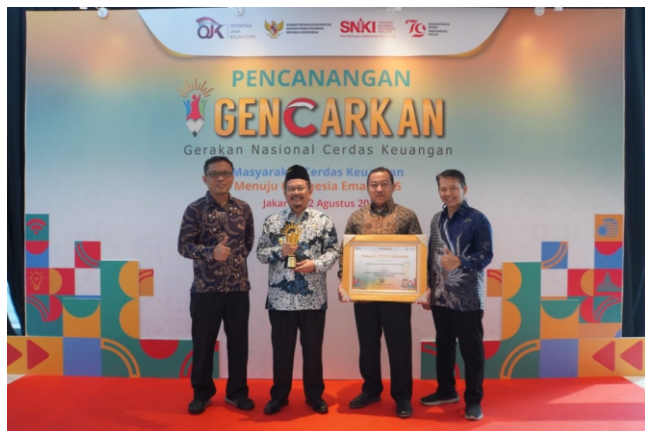
TERANG TANI TPAKD Kabupaten Pasuruan jadi pemenang Financial Literacy Award 2024.

"Semoga jumlah millennial yang bergabung semakin banyak. Dari yang kurang literasi menjadi literasi yang sangat baik," tutupnya. (email)